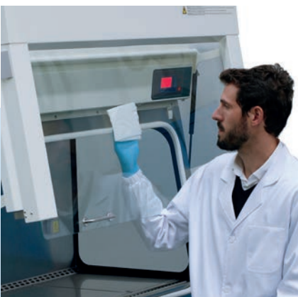
Fácil limpieza del interior del cristal.

La serie Bio II Advance Plus incorpora una pantalla a color que permite comprobar fácilmente y con rapidez los parámetros relacionados con la seguridad. Muestra de forma visual el nivel de colmatación de los filtros, lo cual es extremadamente útil para optimizar el servicio técnico, y la velocidad del flujo laminar para controlar en todo momento el estado de la cabina.